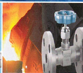
各種製造プラント